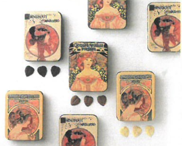
「アマリエ」 リーフチョコレート大佐 ビザンチン/夢想/復草/ (60g)……………各税込1,512円 スペインの老舗チョコレート、独自焙煎の本格派チョコレートを、アルフォン ス・ムシヤのデザイン缶に詰めました。