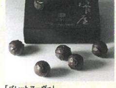
「パレットヌーヴォ」 純米酒ショコラ 純屋 (6個入)……………税込1,540円 香り高い純米酒一斗「純屋」の特別純米酒 を、ビターチョコレートに閉じ込めました。