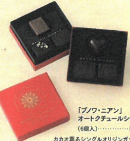
「フノ・ニアン」 オートクチュールショコラ6個入 (6個入)……………税込2,592円 カカオ薫るシングルオリジンガナッシュやプラ ネリなど、「フノ・ニアン」の世界観を堪能で きるアソートです。