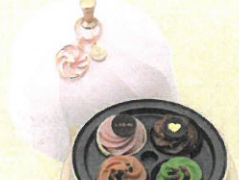
「ゴディバ」 ゴディバフェアリーケーキ ケープセイク (4個入)……………税込3,780円 妖精のケーキをイメージした2019年バレンタ イン限定のチョコレートを、優しい色合いとフォル ムが可愛らしいケースに結合しました。