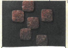
「アンジェリック」 津軽香々歌 (10個入)【各日40個限り】……………税込1,944円 津軽の伝統工芸・津軽巻をデザインした、見 た目も美しいチョコレートです。