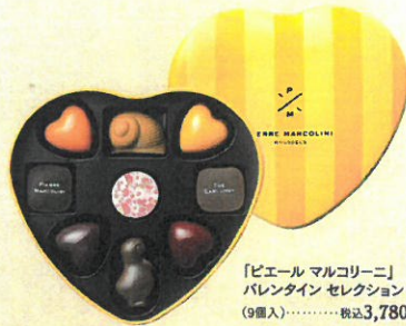
「ビエール マルコリーニ」 バレンタイン セレクション (9個入)……………税込3,780円 ひと粒一粒に物語が詰まった9 種類のプラリネは、記憶に残る 至福の味わいです。