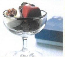
「デジレー」 トリュフ&ハート (8個入)……………税込1,350円 味わい豊かなショコラとトリュフを結合させた魅 力あふれるひと箱です。