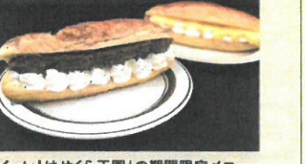
「イーレ!はせくら王国」期間限定メニュー 1月30日(水)~2月6日(水) カカオのあげばん カカオあんホイップ(1個)税込400円 2月7日(木)~14日(木) カカオのあげばん チアミスクリーム(1個)税込400円