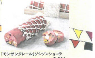
「モンサンクレー」ソシソンショコ ラビー(1本)……………税込2,301円 天然のピンク色とベリーのような爽やかな酸 味を持つソシソンショコラを使ったソシソンショ コラです。