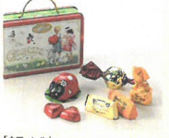
「カファレル」 クオリティー クアトロ (7個入)……………税込1,620円 スイーツ型の可愛い缶に、人気のチョコ レートをアソートしました。