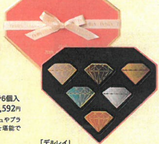
「デルレイ」 ダイヤモンドボックス (6個入)……………税込3,564円 2019年限定のボックスに、ベルギー・アント ワープを象徴するダイヤモンドのショコラを結 合しました。