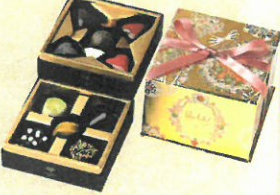
「ビエール・ルドン」 シャトー・ラバシオン (10個入)……………税込3,672円 ベルギーアンレスを情熱的な愛のスパイスで 彩った、あなたを感じるボックスです。