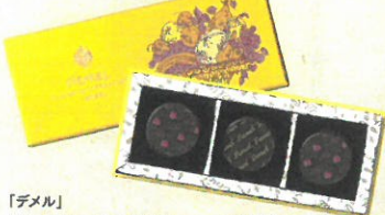
「デメル」 フルフトショコラデ(3個入)……………税込998円 優しい甘みと甘酸っぱさが広がるフルーツガナッシュを スイートチョコレートでコーティングしました。