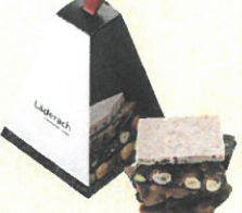
「レダラッパ」 フレッシュ チョコレート (4枚入)……………税込1,998円 スイス産の乳製品と新鮮なカカオ豆を使用し たフレッシュチョコレート。作りたてを航空便 で日本にお届けします。