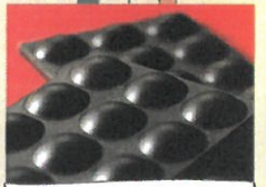
「ルイ・ドゥ・レトワール」 キャラメルショコラ (1枚)【各日40個限り】……………税込1,500円 ベトナム産のカカオトレスを使用したショ コラ。中には、塩キャラメルのクリームを挟み ました。