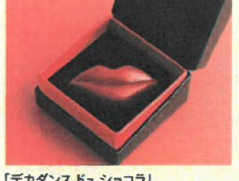
「デカダンスドゥ ショコラ」 ラプキス(1個入)……………税込594円 香り高いルイボスのなめらかなガナッシュを、 真っ赤な唇に閉じ込めました。