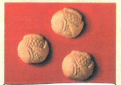
「しよこら亭」 鯛チョコ (7個入)【各日40個限り】……………税込1,782円 最中の中にチョコレートとサクサクお米のクラン チが入った、かわいい鯛の形のチョコレート です。