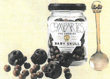
「コンパルテス」 ベイベースカル(66g)……………税込2,700円 「コンパルテス」のアイコンであるスカルチョコと パールチョコの融合。オリジナルスプーン付きです。