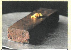
「ゆきむら」 ドモリー プレミアムショコラ (1本)【各日40個限り】お一人様2個まで……………税込2,500円 世界最高峰「ドモリー」のカカオを使いオー ナーショフの高橋幸輝氏が仕上げたショコラ。 とらけだす甘みとカカオの芳香、深みは官能 的と言えほどです。新しいグルテンフリーの ショコラです。