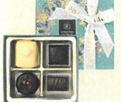
「レオニダス」 プラリネギフトアソート (4個入)……………税込1,181円 ベルギー王室御用達ブランドよりマンカフ をはじめ、人気のプラリネを結合しました。