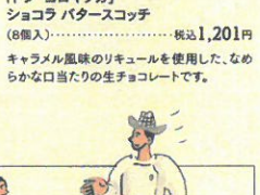
「トシ・ヨロイツカ」 ショコラ パターズコッチ (8個入)……………税込1,201円 キャラメル風味のリキュールを使用した、なめ らかな口当たりの生チョコレートです。