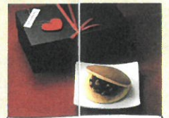
「どら焼き 専門店 丹坊」 ショコラ (3個入)【各日50個限り】……………税込1,300円 クレープ生地で包んだ生チョコに卵焼 を合わせ、ほんのり酒の香りが効いた特 別などら焼きです。