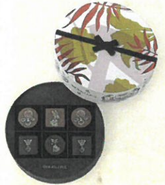
「ドゥバイヨル」 パピユ エパビオン (6個入)……………税込2,592円 マダガスカルから着想を得た2019年バレンタ イン限定ショコラコレクション。大人の遊び 心を感じさせるデザインです。