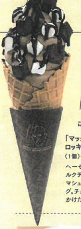
「マックス プレナー」 ロッキーMAXソフトクリーム (1個)……………税込581円 ヘーゼルナッツ風味の濃厚なミ ルクチョコレートソフトクリームに マシュマロとブラウニーをトピン グ、チョコレートソースをたっぷり かけた贅沢なソフトクリームです。